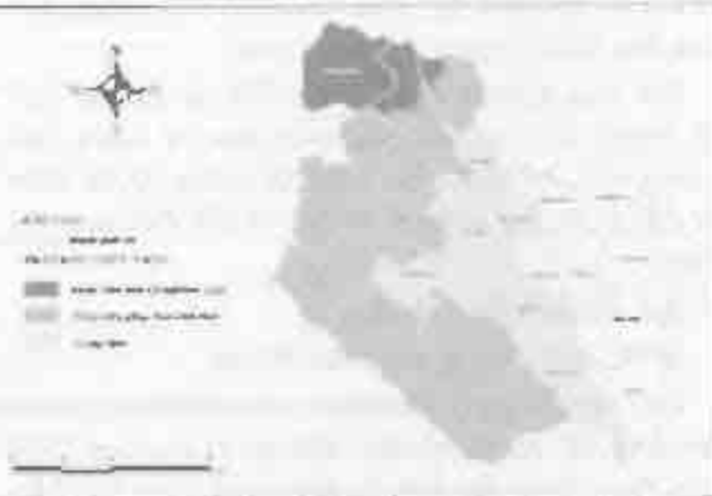
Hình 4. Bản đồ phân khu chức năng dự kiến cho khu bảo tồn tại Lạc Yên

Để xác định ranh giới khu bảo tồn, sự kết hợp giữa bản đồ giá trị bảo tồn và bản đồ phân bố hệ động thực vật là rất cần thiết. Bên cạnh đó, các lớp ranh giới về hiện trạng sử dụng đất cũng như hành