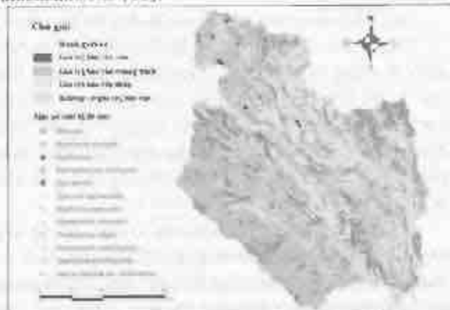
Hình 3. Bản đồ giá trị bảo tồn và phân bố loài bị đe dọa tại Lạc Yên

Kết quả công xếp lớp thông tin giá trị bảo tồn và vị trí phân bố các loài bị đe dọa trên khu vực huyện Lạc Yên (hình 3) đã chỉ ra rằng những khu vực chứa giá trị bảo tồn cao và trung bình tập trung dọc theo ranh giới phía Tây của huyện Lạc Yên, bao gồm các xã Tân Phương, An Lạc, Khánh Hòa, Phúc Lợi và Trung tâm. Tuy nhiên, các loài bị đe dọa chủ yếu được phân bố tại xã Tân Phương và các khu vực lân cận. Từ đây có thể xác định sơ bộ khu vực dự kiến cho phân khu bảo vệ nghiêm ngặt là toàn bộ xã Tân Phương và một phần xã Lâm Thương, Khánh Thiện.